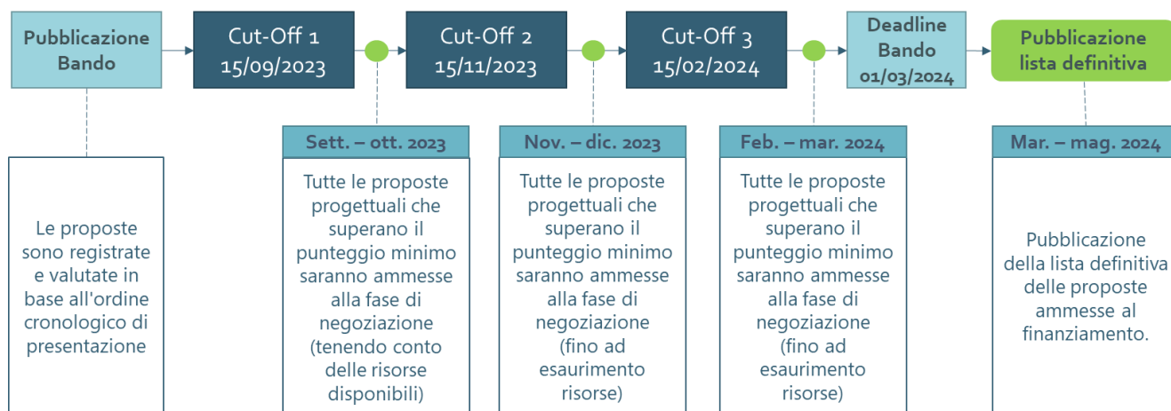
Figura 1 Timeline Bando e Cut-off.

La Figura 1 riporta una timeline dalla data di pubblicazione del Bando a quella della pubblicazione della lista definitiva delle proposte progettuali ammesse.